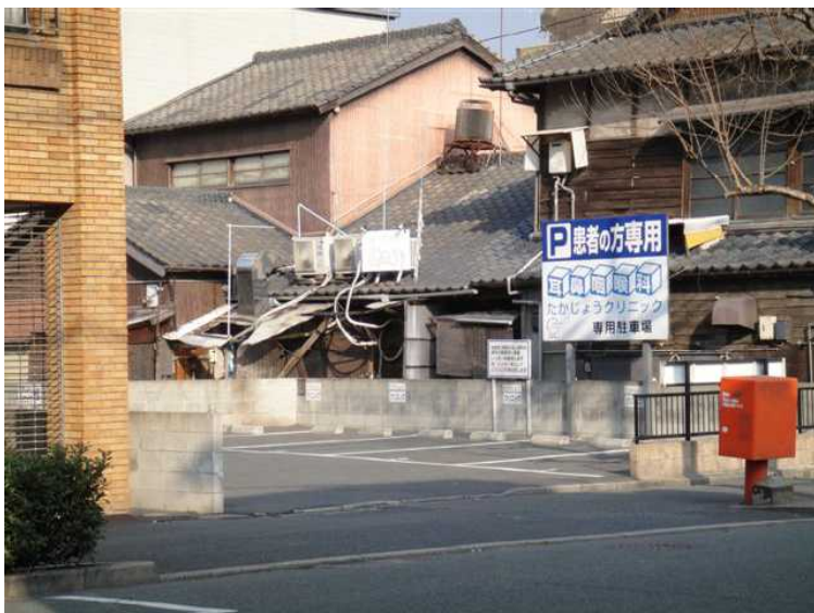
たかじょうクリニック駐車場入り口